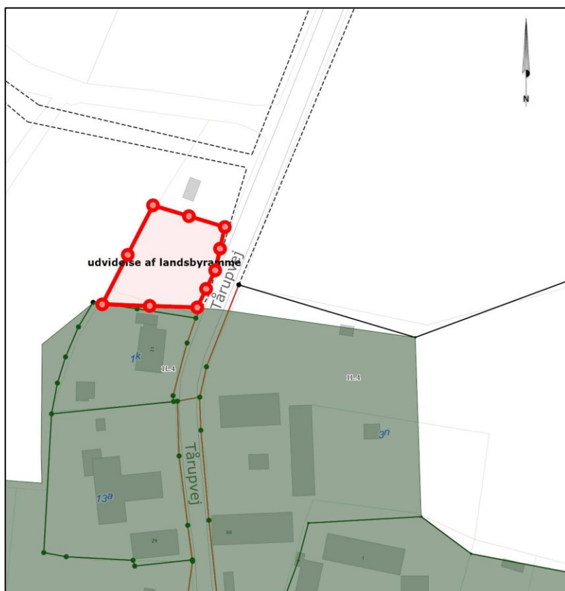
Kort med markering af udvidelse af landsbyafgrænsningen.

Der er i forbindelse med den offentlige høring til Forslag til Kommuneplan 2025 indkommet høringssvar om udvidelse af landsbyrammen 1.L.4 i Tårup, så etablering af en maskinhal i tilknytning til Søren Clausens ejendom på matrikel nr. 1k, Tårup By, Auning kan muliggøres.